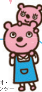
東京都保育人材・保育所支援センターキャラクター ホイクマン