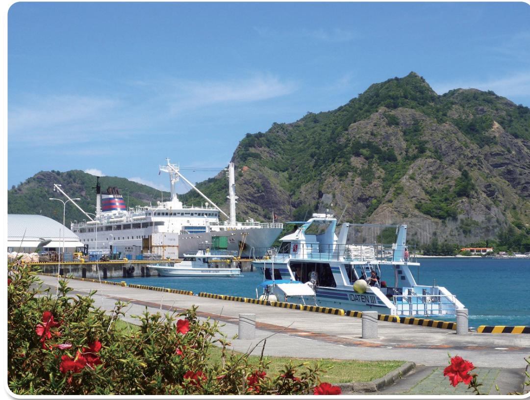
小笠原 父島 二見港