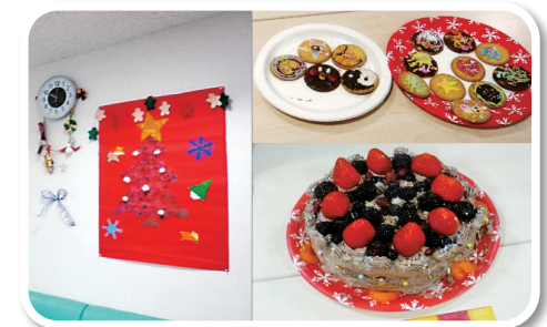
デイケア活動（クリスマス会）