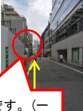
別館はこのあたりです。(一つ目の信号手前左手のビル)

⑥別館(秩父屋ビル)に向かう 約50m直進すると、左手に別館(秩父屋ビル)があります。信号手前の左側の角にある建物が別館(秩父屋ビル)です。