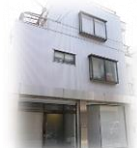
糸でんわ(相談支援)