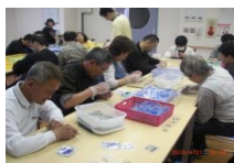
アンジュ(生活介護)