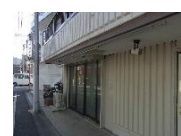
ドロップ(移動支援)