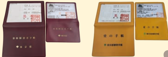
左：紙様式、右：カード様式