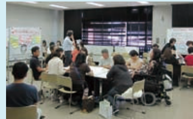
相談支援従事者研修（演習の様子）