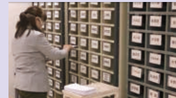
郵便仕分け作業の様子