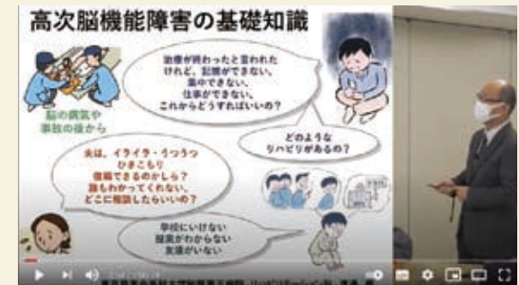
高次脳機能障害者相談支援研修会の様子