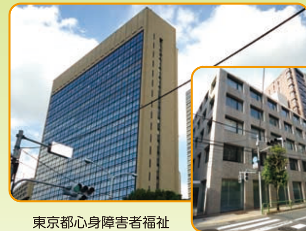
東京都心身障害者福祉センター（本所・左）及び別館（右）

加えて、高次脳機能障害者の支援拠点機関として、ご本人や家族、区市町村・関係機関等への相談支援などを行っています。