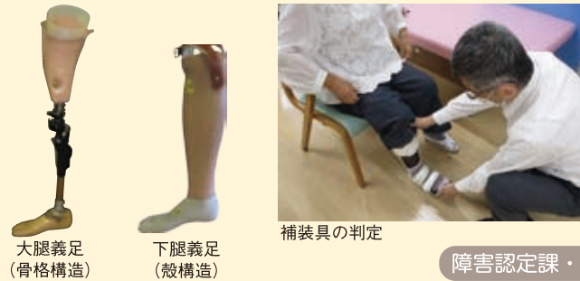
障害認定課・多摩支所