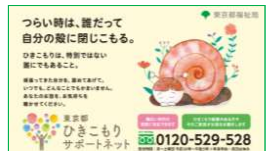
（コンビニ広告静止画イメージ）