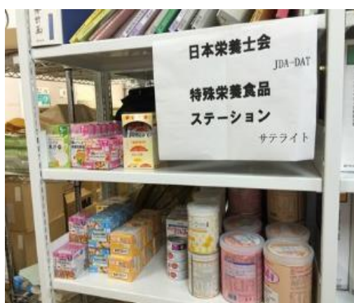
熊本地震の支援（JDA-DAT の活動）より

これは、過去の災害において国や企業等から届いた支援物資が必要な避難者へ届かなかった教訓を踏まえ、平成 27 年 9 月関東・東北豪雨で初めて設置したものです。平成 28 年熊本地震、平成 30 年 7 月豪雨、平成 30 年北海道胆振東部地震においても、被災自治体と連携して設置するとともに、被害が大きい地域には「特殊栄養食品ステーション」の「サテライト」を設置しています。避難所等で配布される食事が食べられない等の避難者については、特殊栄養食品ステーションにご相談ください。