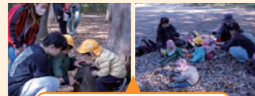
木々や落ち葉に触れながら遊んだ活動

目的地へ向かう途中、子供の様子を見て、予定を柔軟に変更しながら行うことができた活動だった。子供たちとの距離感もよくなり、大人自身も自然を楽しむ姿が出てきた。枝を持って遊ぶ体験をさせるための安全管理について検討した。