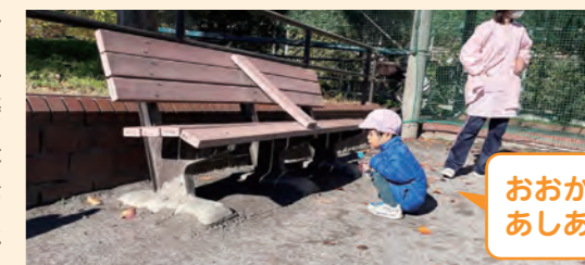
おおかみのあしあとだ！

子供たちが桜の樹の根っこを伝って、バランスをとりながら樹の周りをぐるぐると歩いて遊んでいた。不安定になると木に抱きついたり、そばにあったネットにつかまりながら、転んでも再度やってみるなど、小さなチャレンジを楽しんでいる様子だった。