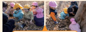
子供も保育者も冬の自然に気づいた活動

落ち葉や小さな虫など冬の自然を感じる遊びが体験できた活動だった。子供の声を聴き、遊びに気づく関わりができていたが、寄り添い過ぎてしまった。子供たちにどこまで寄り添うか、切り替えのポイント等について話し合った。