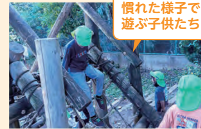
慣れた様子で遊ぶ子供たち

今回の活動の意図は「友達と一緒に体を使って遊ぶ」ことだったので、アスレチックや斜面がある公園を選んでいった。子供達はアスレチックや斜面・すべり台などで、意欲的に体を動かしていた。保育者は立ち位置を確認し合う等、声をかけ連携することで安全に配慮しながら、子供たちがより自由に過ごせるように考慮していた。