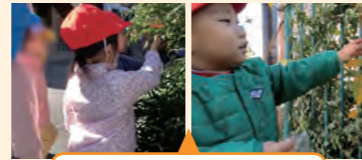
ゆったり散歩と身近な公園での活動

木の実等を探しながら、近隣をゆっくり散歩。その後、広場で様々な遊びを見つけて、遊ぶ子供たちの姿があった。子供たちの姿を的確に捉えて道具を出すタイミングを計ることや見守っていく関わりを大切に確認した。