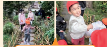
散策路で自然を体験した活動

見通しが悪い場所での自然遊びだったが、子供たちがいるんなことによく気づきながら遊んでいた。保育者自身が自然の匂いなどを楽しみながらも、子供の気づきや体験を大切にしている関わりだった。