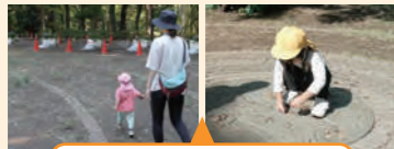
見通しの良い広場での活動

事前視察時のアドバイスをもとに、見守り保育を実践したところ、かえって子供たちと距離が離れ過ぎてしまった。子供たち一人一人は遊んではいるが、保育者の関わりが薄くなってしまっていた活動だった。また一人走り回る子供の対応についても検討した。