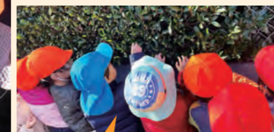
おもしろいものいっぱい！

近隣の自然物を観察しながら、ゆっくりと散歩。保育者があらかじめ見つけていた柿の木や夏みかんをみんなで立ち止まって見たり、子供たちの目線の高さにある、植木の赤い実や落ちていたみかんなどを自分たちで見つけて楽しんでいた。またクリスマスの装飾を見て喜ぶ姿もあった。近隣の植木や装飾物などを楽しむ散歩だった。