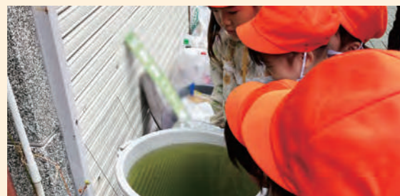
これなんだろうね？

子供の興味が向くようなものがある道を選んで、商店街を通り目的地へ向かっていた。それにより、子供たちのおしゃべりが弾み、楽しみながら歩いていた。子供が面白いものを見つけるとみんなで立ち止まり、他の子供たちも見るように配慮しながら進んでいる様子で、街を楽しむお散歩となっていた。