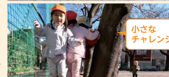
小さなチャレンジ