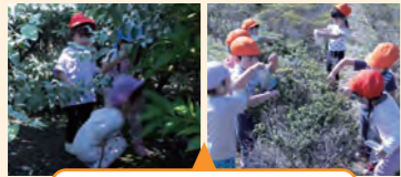
河川敷の迷路のような植え込みでの活動

迷路のようになっている植え込みに入ったり木の実を摘んだり、子供たちがのびのびと遊ぶ姿が印象的。危険そうに見えるところも子供自身が危険を回避している行動が見られた。帰る時の促しが穏やかだった。