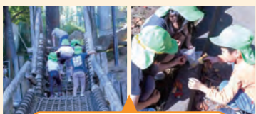
アスレチック遊具のある公園での活動

アスレチック遊具で体を十分に動かして遊んだり、落ち葉や石を寿司に見立てて遊んでいた。友達とアイデアを出し合い、協力して遊ぶ姿が印象的な活動だった。