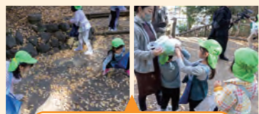
降りそそぐ落ち葉で遊びが広がった活動

公園の豊かな自然で、子供達が自発的に落ち葉や木の実を拾って遊ぶ。個々で楽しむと共に、お互いを意識し合いながら集団としてつながり合い、助け合う姿が見られた。