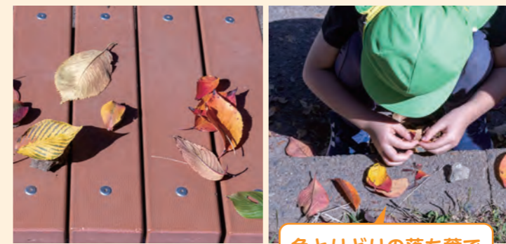
色とりどりの落ち葉でお寿司やさんごっこ

大きな枯れ木を見つけて、友達と協力して運ぶ子供たちがいた。「あ、クモがいる」「クモさんのお家なんだよ。だから運ぶのをやめよう」などと興味深く観察したり、想像を膨らませて話し合う姿があった。保育者は安全に配慮しながら、子供たちの会話を聞いていた。