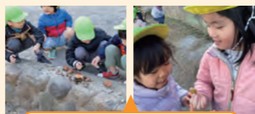
なんでも無い場所にも自然を見出した活動

一見何も無い場所で、自然物に興味を示し、遊びを見つけて遊び込んでいた。小石や木の実を観察したり、お寿司屋さんをしたり、個々の遊びが全体につながり合っている姿が印象的だった。