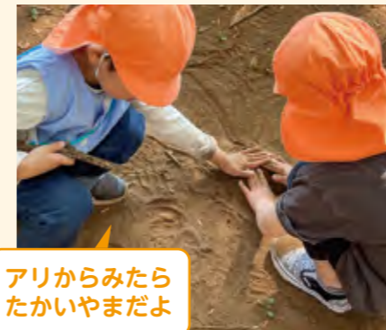
アリからみたら たかいやまだよ

「落ち葉アートのための落ち葉拾い」がこの日の目的。保育者にとっては落ち葉拾いは遊びではなく活動で、活動をした後に、遊ぶために梅林へ場所を移動するという計画だった。子供たちに移動を促すが、ほとんどの子供達はその場で遊びが始まっていた。