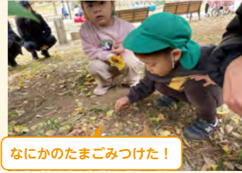
なにかのたまごみつけた!

保育者の「集まるよー」という声を聞いて、スムーズに集まる子供たち。普段は笛を使って集めているが、今回は笛を使わずに、帰りの声かけを試みた。声かけのみで5分程度で全員が集まって来たため、引き続き、自然な促しを意識して工夫して行ってほしい。