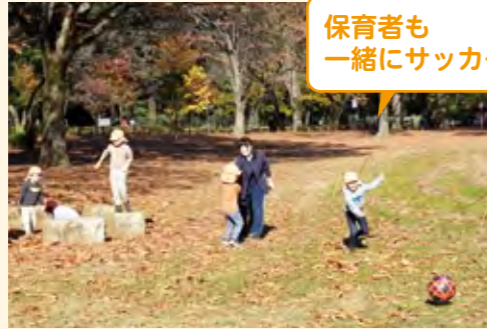
保育者も一緒にサッカー

広場に着くと、落ち葉で“花火大会”(上に投げる遊び)をしたり、大きな落ち葉拾いやボール遊びなどをする子供たち。ボール遊びでは、ボールを一人一つ持ち、蹴っては追いかけたり、5歳児と保育者でサッカーをしたりした。ボールをたくさん持って行ったが、サッカーをしたい子の分だけ持って行く等、ボールを持っていかを事前に子供と決めてもよかったかもしれない。