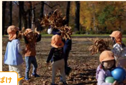
はっぱおばけやって～

保育者が葉っぱお化けになり、子供たちがやっつけるという戦いごっこを行っていた。ボールを「ばくだん」に見立てていた。保育者が子供たちに声をかけてゲーム性のある遊びを提案したり、子供にせがまれて、追いかけてこやごっこ遊びを展開する姿が多く見られた。