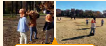
広場で保育者と一緒に遊ぶ活動

落ち葉拾いやボール遊びに出かけた。保育者が先導し、おぼけごっこ・サッカーなど、あちこち走り回りながら遊ぶ子供たちの姿が多くみられた。保育者を介したゲーム性のある遊びが多かった。