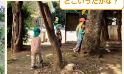
チョウチョどこいったかな?