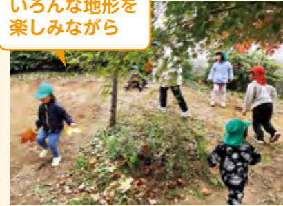
いろんな地形を楽しみながら