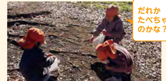
だれかたべちゃったのかな？

数人の子供たちが長縄や縄跳び用のロープをただ持って走り回っていた。園長が危険を感じ、止めて電車ごっこを提案した。振り返りでもこのことに触れ、道具を使う時の意図や使い方を伝える必要性を話し合うことができた。また「何でもありではない」ということも確認することができた。