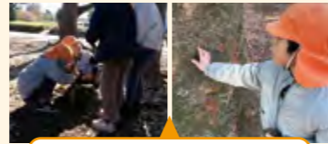
自然物での見立て遊びが広がった活動

どんぐり拾いのほか、枝や樹皮等の自然物を使って、焚き火ごっこや焼肉屋さんなどの遊びを作り出す子供たち。それぞれがじっくりと遊びを深め、展開する姿が見られた。