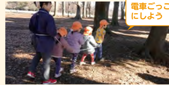
電車ごっこにしよう

数人の子供たちが長縄や縄跳び用のロープをただ持って走り回っていた。園長が危険を感じ、止めて電車ごっこを提案した。振り返りでもこのことに触れ、道具を使う時の意図や使い方を伝える必要性を話し合うことができた。また「何でもありではない」ということも確認することができた。