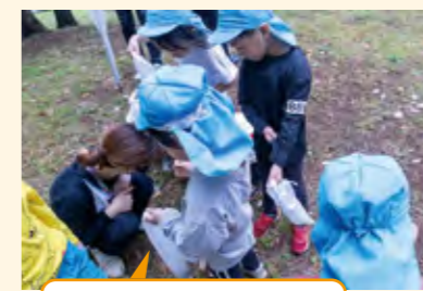
一緒に楽しむ保育者

子供たちと同じくらい保育者もどんぐりを拾い、夢中になる姿が見られた。その楽しそうな様子に、子供たちは惹かれ、保育者の周りに集まり、遊びを共有した。子供の声から、保育者がペンを出してどんぐりに顔を描いていた。