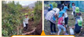
保育者も楽しみ自然遊びが広がった活動

近隣の公園にてどんぐり拾いや生垣に潜り込んで遊んでいた子供たちと一緒に、保育者も楽しんでいた姿が印象的だった。その中で、保育者間の連携が必要だということも認識した。