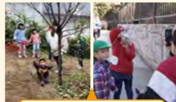
子供自ら自然を見つけ遊びが広がった活動

“お土産バッグ”に子供たちが思い思いの自然物を入れる。大きな石や枝などを入れる子も。大人の予想を超えた物を拾う子供の姿に驚く保育者の姿があった。保育者が楽しんでいる姿に子供たちの興味関心が深まった。