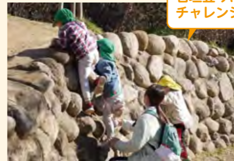
石垣登りにチャレンジ

帰る時間に、鳥の巣を見つけて保育者に見せる子供がいた。もう並んでいた子供たちも鳥の巣を見たり、リーダー保育者は「みんなで行っちゃおうか!」と決めて、全員で見に行った。計画がありながらも、子どもの“今”の姿を尊重する保育者の姿があった。このように子供たちの声を拾える心と時間の余白があることが大切。