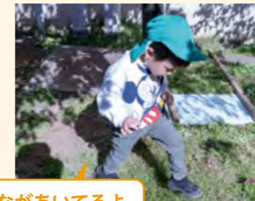
あながあいてるよ

蝶々を追いかけて捕まえようとしていたり、木の実を拾ったり、木の割れ目の中を覗き込んだりし、自然物に関心を持つ子がいた。また、地面にあいたセミの穴を見つけた子は、保育者に知らせと一緒に観察していた。