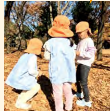
子供同士で揉めながら過ごしていた

1人だけポツンと座っている子供の姿があり、様子を見てみると、4歳児の女の子2人と揉めていた。その後子供同士でなんとなく仲直りし、お家ごっこが始まったが、また他の男子と揉めている姿があった。一人の子の中に未消化の何かがあることが見てとれた。心が落ち着かず、じっくりと遊びを深めることがなかなかできない様子だった。