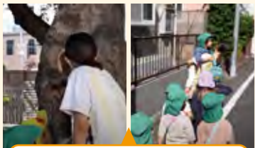
子供を尊重しすぎる保育に課題が見えた活動

散歩の出発時や道中で歩きたくなくなる子供たちに保育者が寄り添って対応。公園では3グループで別々に鬼ごっこが始まった。茂みの中でのごっこ遊びや蝶々を追う子供たちの姿には、異年齢児の関わりの良さも見られた。