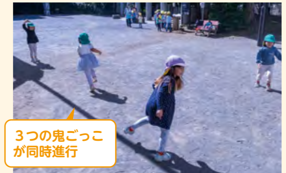
3つの鬼ごっこが同時進行

散歩の出発時や道中で止まってしまう子や、機嫌が悪くなり先頭の保育者に抱っこしてもらおう子がいた。保育者はそれぞれ1対1で対応し、寄り添っていた。子供に寄り添うことは大切であるが1人の子供に注目し過ぎず、保育者同士が声をかけ連携し合いながら全体へ目を配り、安全に散歩ができるようにすることも大切である。