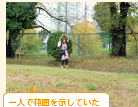
一人で範囲を示していた