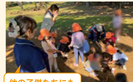
他の子供たちにも 遊びが広がった

サラサラの土で山を作っていた年長児が「みずがあればな～」とつぶやいたことをきっかけに、水を使って土の器づくりの遊びが始まった。器ができた瞬間、子供たちの発見と感動が見られた。一緒にいた3歳児の心も動き、見様見真似で作っていた。その後移動した先でも、子供達は器作りに夢中になり、その姿が他の子供たちへ伝染し、遊びが広がっていった。試行錯誤する様子を子供同士でよく見て、学んでいた。3歳児が5歳児をよく見て真似て、自分で作った時の嬉しそうなお顔が印象的であり、縦割りの良さがよく表れていた。また、最初の場所で体験している子としていない子の水の扱い方の違いが見られ、興味深い姿も見られた。