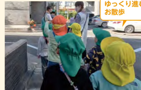
ゆっくり進むお散歩