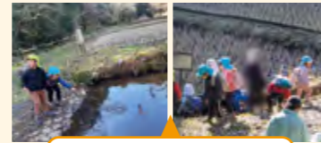
子供の探究心が発揮された活動

田んぼ周辺で広範囲に活動が広がる。水路の流れや池の深さなどに好奇心を持って遊ぶ子供の姿が印象的だった。しかし、水辺と寒さへの安全管理の面で、下見を活かせなかったこと、保育者間の確認不足等の課題が見えた。