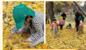
イチョウの落ち葉に吸い寄せられた活動

子供たちが固定遊具だけでなく、自然環境に関わりながら自ら遊びを見つけていた。子供たちの様々な発見を保育者も共に楽しむことで、子供たちのつぶやきに気づいたり、心の動きを感じ、子供の姿をより捉えることができる。