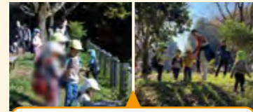
通りで自然物に気づき遊びが始まった活動

遠くの公園への散歩。なんでもない通道の一角で、様々な自然物を見つけ、遊び込む子供の姿が印象的だった。安全管理や子供の姿の捉え方などにおいて、多角的な視点が大切だと気づいた。