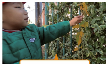
ゆったり散歩と身近な公園での活動