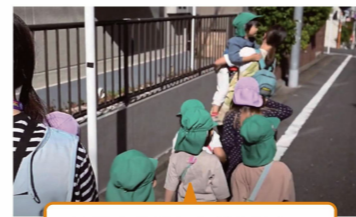
子供を尊重しすぎる保育に課題が見えた活動