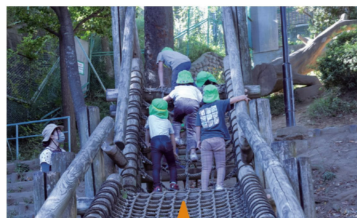
アスレチック遊具のある公園での活動