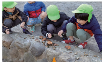
なんでも無い場所にも自然を見出した活動