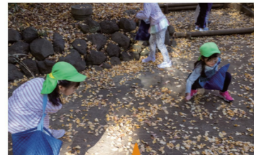
降りそそぐ落ち葉で遊びが広がった活動