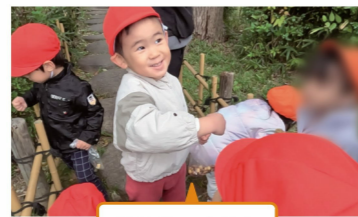
散策路で自然を体験した活動