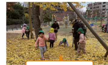
イチョウの落ち葉に吸い寄せられた活動