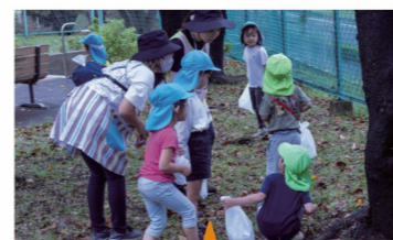
保育者も楽しみ自然遊びが広がった活動