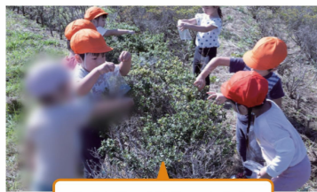
河川敷の迷路のような植え込みでの活動