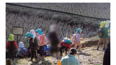
子供の探究心が発揮された活動