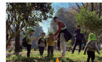
通り道で自然物に気づき遊びが始まった活動