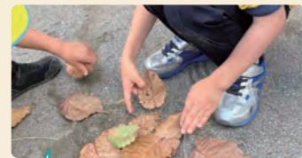
虫かごの代わりになんとか葉っぱでお家を作ろうとしていた子供たち。