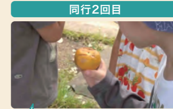
落ちていた柿を発見。匂いはどうかな？ 恐る恐る嗅いでみる。