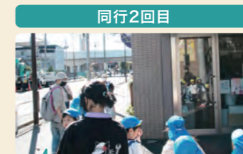
駅前を通ると興奮気味の子供たち。地域環境を感じる散歩も子供たちにとっては楽しいひと時。