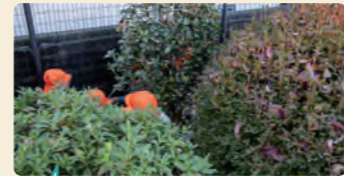
公園の植え込みは迷路になり、お家になり、子供たちの大好きな場所に。