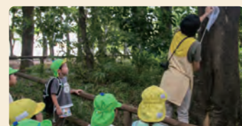
虫好きな保育者がカブトムシを見つけると子供たちは興味津々。