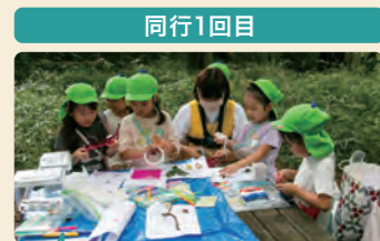
子供たちが遊べるようにと、工作材料や道具を持っていった。