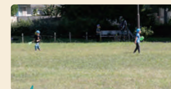
広い公園で、のびのびとトンボを追う子供たち。