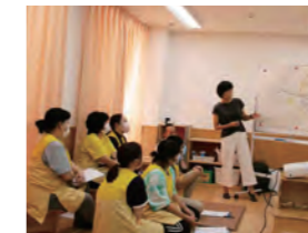
事前打合せ(現状把握)