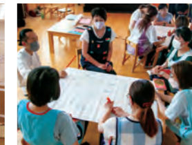
導入研修(目線合わせ)