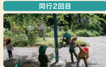
藤棚のツルが伸びて、子供がちょうどぶら下りやすい長さに。