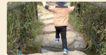
小川ジャンプで力試し。以前は失敗して靴を濡らすこともあったが、今回はできた！