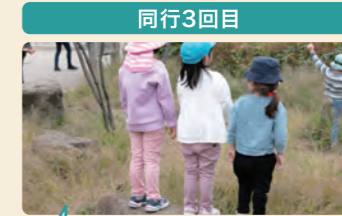
大きな岩ではジャンプをしたり舞台になったり様々な遊びが展開。