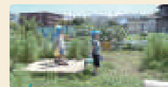
トンボや蝶をバケツを持って追いかける子どもたち。