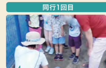
コガネムシに興味津々。捕まえないけど触れない様子の子供たち。