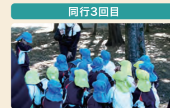
3つのグループに分かれての遊び。広い公園での安全管理の工夫。