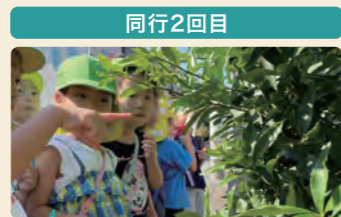
公園への道中でも自然体験。アゲハの幼虫を突くと「ツノがでた！くさい！」と驚いた子供たち。