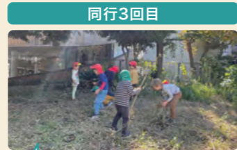
前回背が高かった雑草が刈られていた。同じ場所でも季節によって変わる。