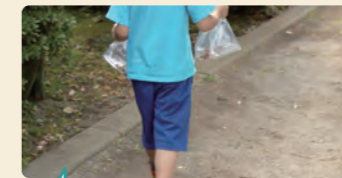
公園の端で見つけたセミの抜け殻やキノコは子供の大事な宝物。