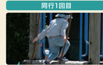
公園の遊具でチャレンジ。試行錯誤しながら登ることで達成感を味わう。