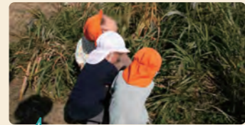
友だちと一緒に力を合わせてススキの穂を取ろうとする2歳児の姿。