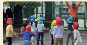
毎日体操をしている近隣のおじいさんにこの日初めて関心を持った子供たち。