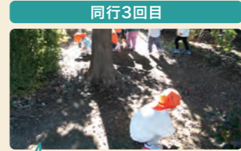
地面いっぱい落ちていたどんぐりを夢中になって拾って楽しんでいた。