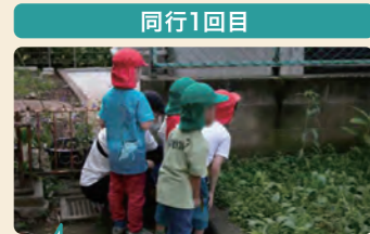
保育者が虫に触れさせたい一心でバッタやコオロギを探していた。