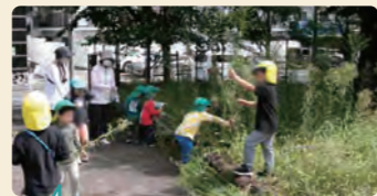
子供たちよりも背が高くなった草の草むらで遊ぶ子供たち。