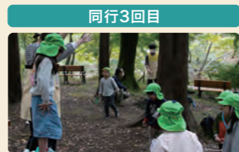
散歩中のおじいさんに教えてもらい、紅葉の種のプロペラを飛ばして遊ぶ子供たち。