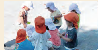
保育者が持っていった砂場道具で遊ぶ。自然物も使いながら遊ぶ姿があった。