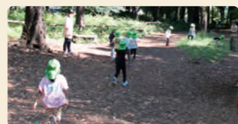
子供たちの声でどこに行くかを決めながら進んでいく。