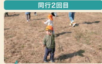
その場にある自然物で遊ぶ子供たち。遊具がなくても遊びが広がる。