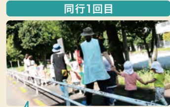
片道35分のお散歩でも、子供たちがおしゃべりを楽しみながら歩いている姿。