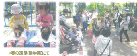
*春の遠足(動物園)にて