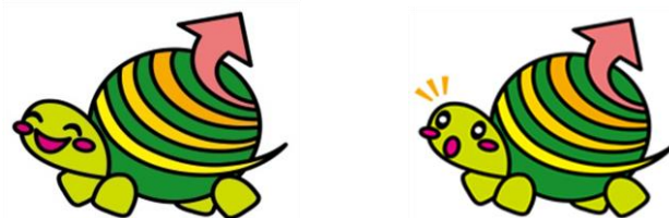
東京都福祉サービス第三者評価マスコットキャラクター「ひょうカメ」