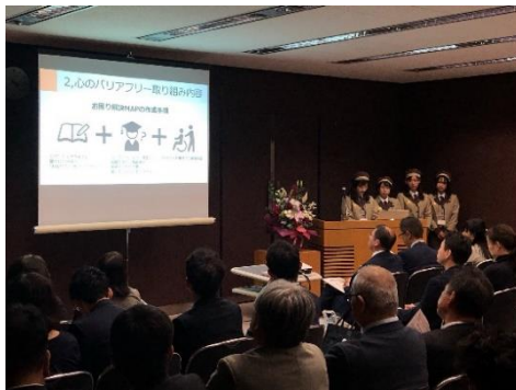
右：好事例企業の報告