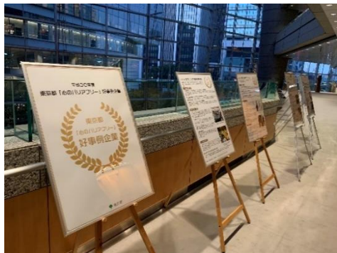
都主催イベント「ヒューマンライツ・フェスタ東京2019」の様子 左：通路におけるパネル展示