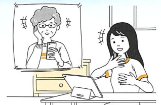
●家族や友人との会話