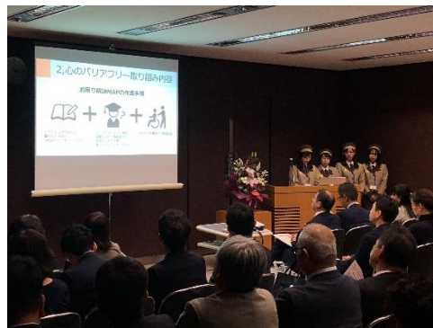
右：好事例企業の報告