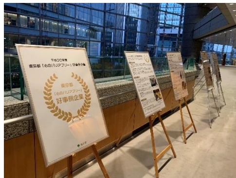
都主催イベント「ヒューマンライツ・フェスタ東京2019」の様子 左：通路におけるパネル展示