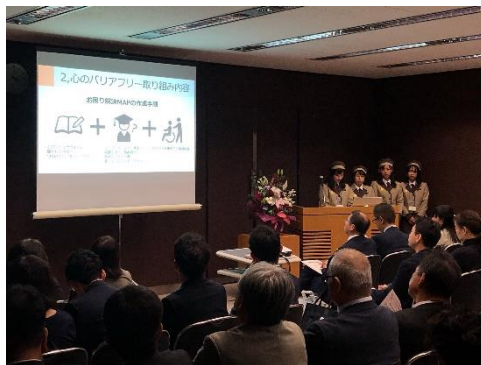
都主催イベント「ヒューマンライツ・フェスタ東京2019」の様子 左：通路におけるパネル展示 右：好事例企業の報告