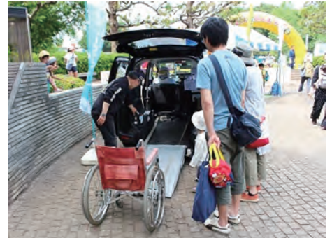
地元の商工祭りでのUDタクシー乗降体験

地元の行政や商工会と連携して、市民祭り及び商工祭りにおいて、UDタクシーの実車展示や車椅子乗降体験を実施しています。これらのイベントには乗務員が毎年参加しており、市民の車椅子利用者に対する理解促進に貢献しています。