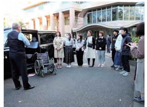
地元の大学でのUDタクシー講習