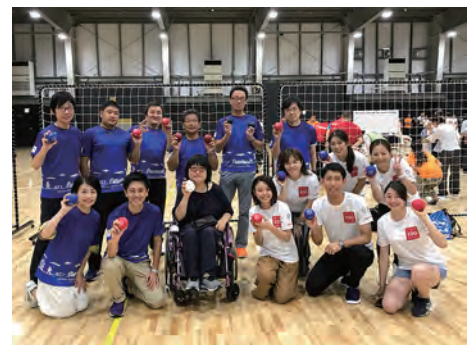
グループ横断のボッチャ大会