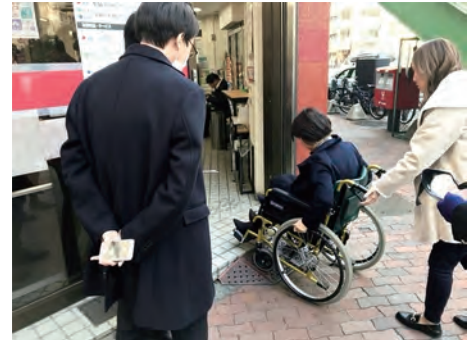
車椅子に乗車して街のバリアを体験する従業員

全国で実施されている様々なスポーツ大会やコンサートなどのイベントで、来場された障害のある方や高齢の方に、会場の説明や案内などのサポートを行うボランティアに協力しています。研修で学んだ内容を実際の活動として実践することが、従業員の成功体験につながり、心のバリアフリーの理念を根付かせています。