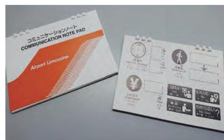
ピクトグラムや外国語を盛り込んで作成したコミュニケーションノート