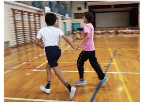
小学校におけるパラスポーツ体験授業

特例子会社に在籍しているブラインドマラソンの選手とブラインドサッカーの選手が講師となり、2018 年度から自治体と連携して地元の小中学校においてパラスポーツの授業を実施しています。児童や生徒が実際のパラスポーツを体験し、障害に対する理解を広げています。