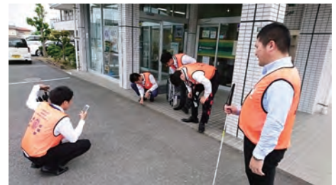
街のバリアフリー情報をアプリに投稿する従業員