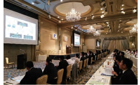
事業所ごとの取組を経営陣の前で報告している様子

「ダイバーシティ推進活動」では、障害のある方への情報発信を重点項目に位置付けています。車椅子ユーザーの従業員の発案により、ホームページ上に「ユニバーサルデザインへの取り組み」ページを作成し、各ホテルの詳細なユニバーサル情報を写真付きで発信しています。