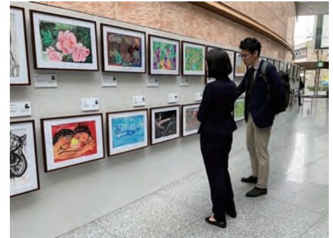
「可能性アートプロジェクト展」の様子

障害者アート作品をオリジナル紙製飲料缶「カートカン」や卓上カレンダー、ノベルティグッズ、絵本出版などに加工して商品化しています。障害者アーティストにアート使用料を支払うことで、アーティストの経済的自立を支援するとともに、障害者アート作品の理解・普及を促進しています。