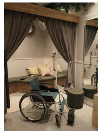
「みんなのフィッティングルーム」