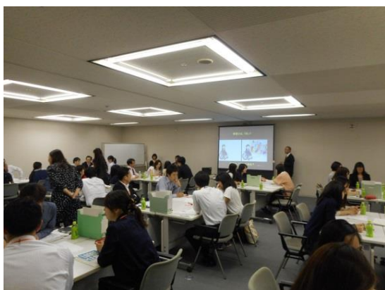
<多くの参加者が集まり、会議室は満員>

この日は、「障害とは何か」等を考えるための「障害平等研修（Disability Equality Training）」を体験しました。今回の「ニュース レター」は、障害平等研修を体験した参加者から6人の皆さんの感想を紹介します。