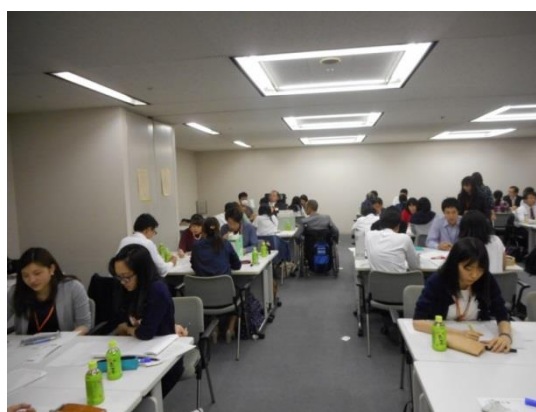
<車いす使用者の動線は確保します>