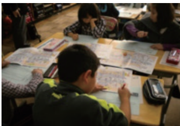
小学校での実施風景