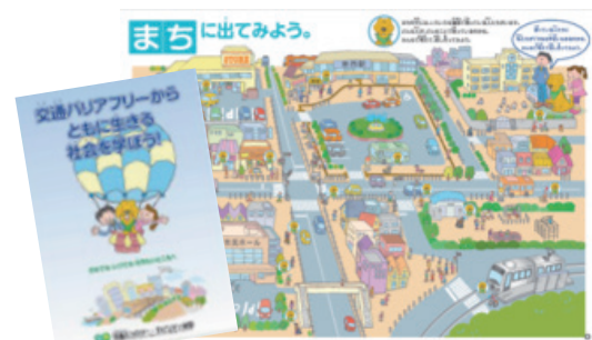
フレッシュコース冊子