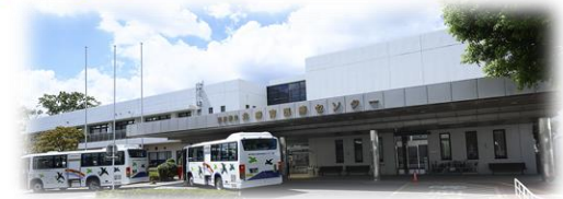
北療育医療センター