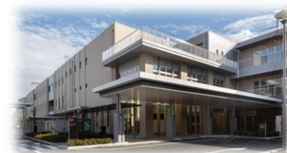
府中療育センター