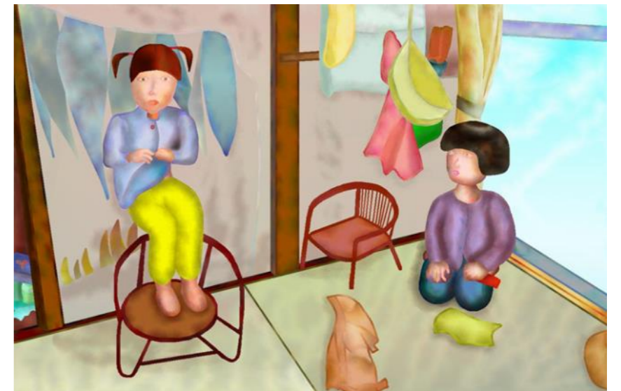
Kさん入選作品「あの。おねえ、あぶないよ」

東京都 公益財団法人 日本チャリティ協会 TEL:03-3341-0803 FAX:03-3359-7964 http://www.charitykyokai.or.jp/