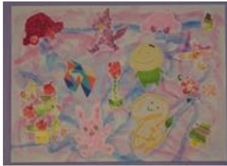
Aさん、Sさん「チューリップのひみつ」