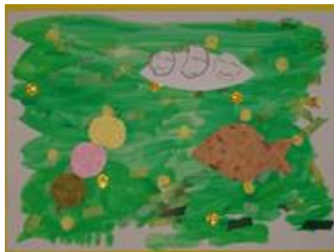
Uさん「わたしの好きなもの」