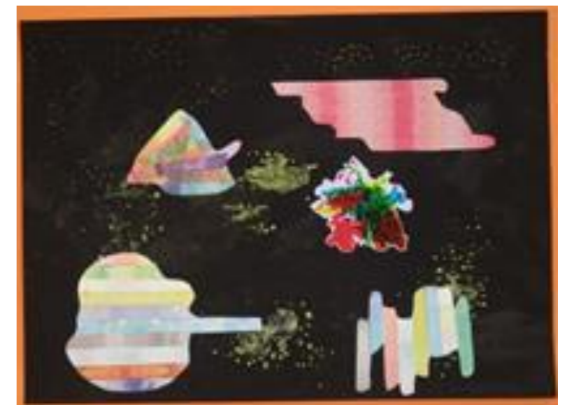
Uさん入選作品「ハッピーだねの宇宙」