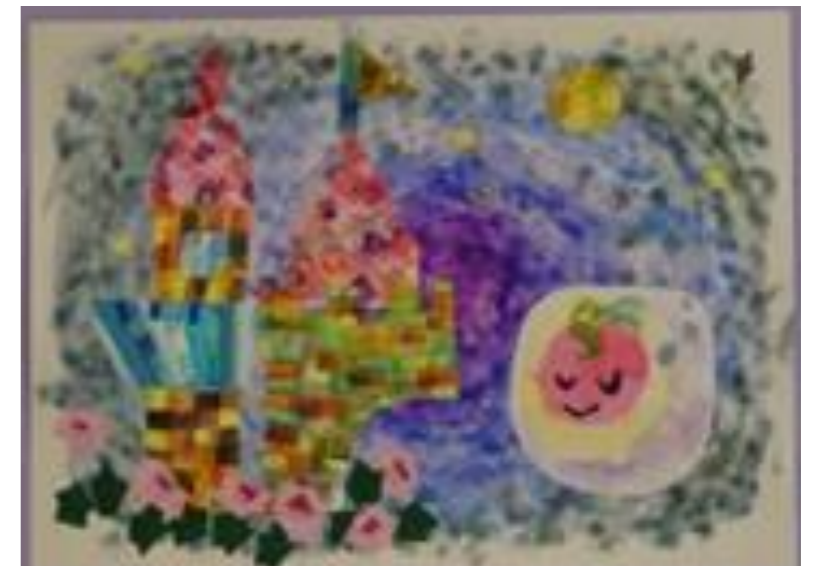
Tさん入選作品「眠りの国の王女様」