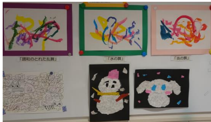
利用者の方々の力作です！

できる日を楽しみにしています。日中活動では、利用者の興味関心や発達段階に合わせた少人数でのグループ活動、個別活動で感覚刺激やリラクゼーション、コミュニケーションなどを取り入れた活動を行っています。制作活動で作った作品は、病棟のカラーが出ていると思います。病棟入り口を飾っていますので是非ご覧ください。