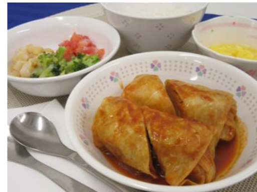
< ロールキャベツ (普通Ⅲ量) > 222kcal たんぱく質 13.8g 食塩相当