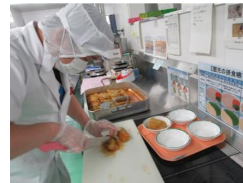
ベテランの調理師が腕をふるいます！