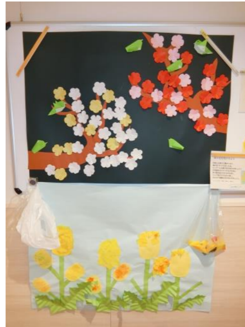
季節にあった きれいな飾り付けがされています

「指導担当」の福祉職員は1人2病棟、心理職員は2～3病棟と通所、短期入所者を担当し、利用者の方の日中活動支援を行っています。心理職員は心理アセスメントをします。病棟をこえたグループ活動や個別活動、保育担当との病棟活動などを通して、利用者の皆さんが様々な刺激を受け、気分転換やリラックス、楽しい時間を過ごし、生活が豊かになるように日々奮闘しています。季節ごとの生活療育支援科行事の企画、府中療育センター祭の事務局なども行っています。2階の科の廊下はいつも利用者の方の作品展示や季節の装飾でにぎやかにしていますので、ぜひお立ち寄りください。