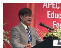
シンポジウムの座長