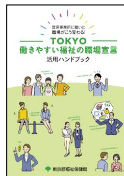
活用ハンドブック