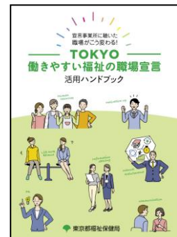
活用ハンドブック

https://www.fukushijinzei.metro.tokyo.lg.jp/www/contents/1625805816780/index.html