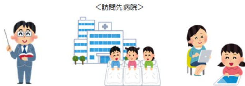
教員による訪問教育