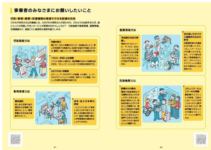
「さまざまな場面での配慮事例」を記載しているページ