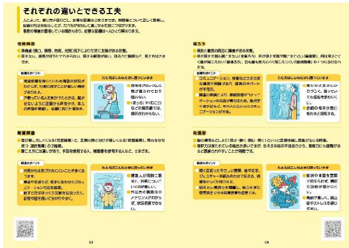
「さまざまな障害特性について」を記載しているページ