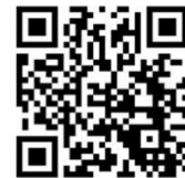
研修申込システム QR コード

≪URL≫ https://study.tokyo.med.or.jp/publish/