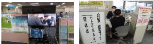
【人材確保・就職支援コーナー風景】