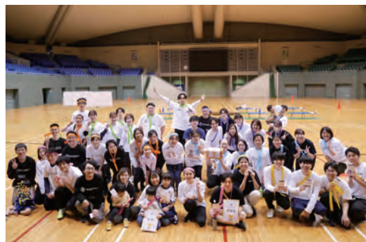
サクラグDEI運動会の様子