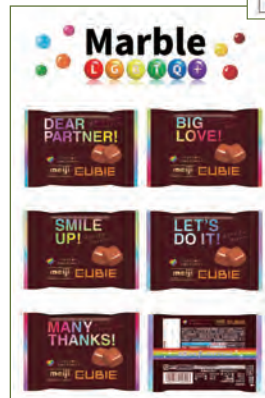
CUBIEダイバーシティ パッケージ