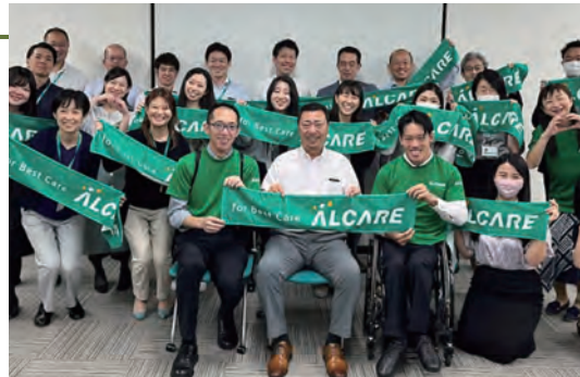
10月は障害の理解を深める月間（2023年開催時）

2015年より、所属パラアスリート社員が小中学生に向けてパラスポーツや自身の障害、車いすの方への声掛けや介助方法について出前授業を行っています。また、オストメイトの社会的認知拡大と理解促進に向け、外部団体が実施するイベントへの協力や防災の日をきっかけとした災害対策などのニュースリリースを発信することで、誰もが自分らしく生きられる社会の実現を目指しています。