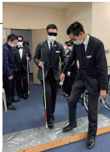
介助サポート力向上セミナー (視覚障がい者・サポート者体験)

2022年度より保有語学資格やTOEICスコアに応じ人事評価に加点する制度を設け、語学力の底上げを図っています。また、2023年度は英会話スクール通学等の補助を行った他、外国人研修生とのコミュニケーションを通して効果的な学習方法、ならびに異文化理解を深めました。これらの取組により、回復傾向の訪日客へのより踏み込んだ接客を目指しています。