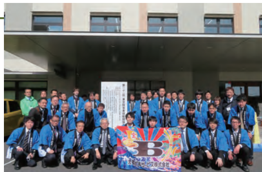
アビリンピック競技会集合写真

施設を利用する方には老若男女、障害者、外国人がおり、障害者一人ひとりの特性、また国々で違う様々な習慣や風習、そして年配者の状況があることを踏まえ、弊社管理物件において、見落としがちな段差や溝など事故の危険性が高まる箇所には、適切な誘導、危険表示や目立つ色を付けるなどの注意喚起、施設所有者への改善提案などにより施設利用者の安全確保に努めています。