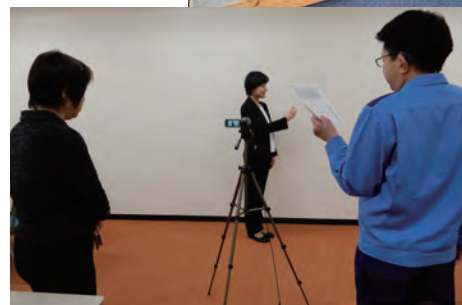
自主制作の手話研修動画 撮影風景