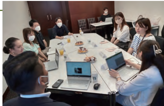
「子育て中社員の働き方」など様々なテーマで座談会を実施

不定期で年間数回、テーマを設定して従業員参加型の座談会を行っています。今年度は「子育て中社員の働き方」「D&Iを職場で推進するには」をテーマにテーブルトークを行いました。従業員の生の声を聞く貴重な機会であり、また従業員同士での意見交換の様子を社内報にて共有することで、「もっと会社を良くしたい」という思いを全体に波及させていくきっかけにもなっています。