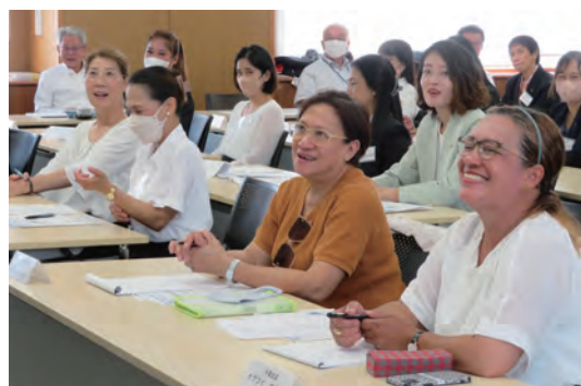
外国人研修会の様子