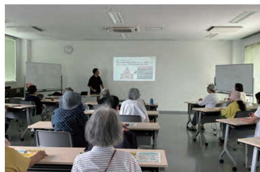
シニアの方向けにみんなの情報モラル講座を実施している様子