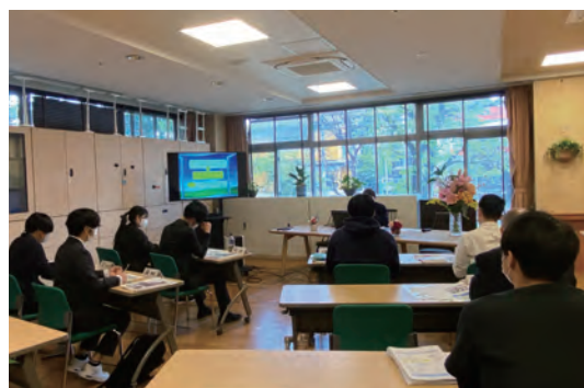
入社式後に行った障害者理解の研修の様子