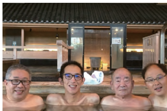
旅行代理店と連携したオストメイト向け温泉ツアー（第1回）