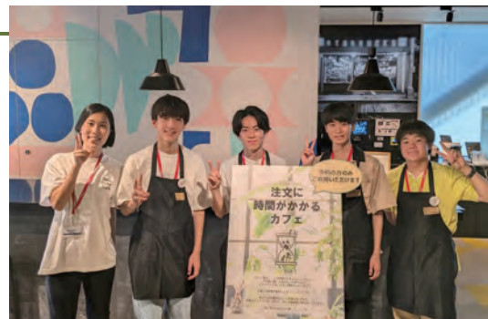
注文に時間がかかるカフェ実施時の様子

特別支援学級に所属する小学校・中学校の生徒向けの職場体験を実施しました。特別支援学級向け職場体験の機会が少ないという現場のニーズから生まれたイベントで、弊社の現場から出る廃材を用いてお台場の街を再現するワークショップを行いました。先生方、生徒さんからも好評を得ており、来年度以降も継続実施をしていく予定です。