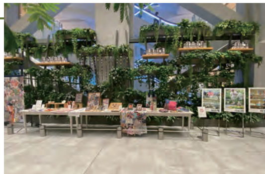
玉川高島屋において開催した「障害者の芸術の世界」

認知症の方やご家族、地域住民、医療・福祉関係者でタスキをつなぐイベントを当法人の地域包括支援センター主催で2回開催。認知症の方々が笑顔で参加され、安心して地域で暮らし続けることができることを実感していただきました。「一人ひとりの希望及び権利が尊重され、ともに安心して自分らしく暮らせる街」を目指している世田谷区に賛同し、認知症カフェを4事業所で開催しています。