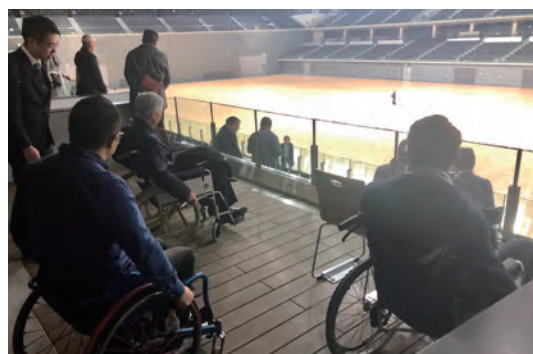
「心のバリアフリー」教育における「車椅子体験」の様子