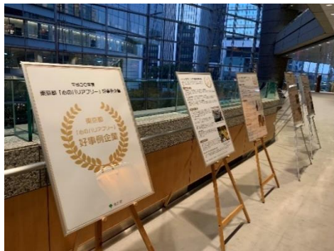
都主催イベント「ヒューマンライツ・フェスタ東京2019」の様子 左：通路におけるパネル展示