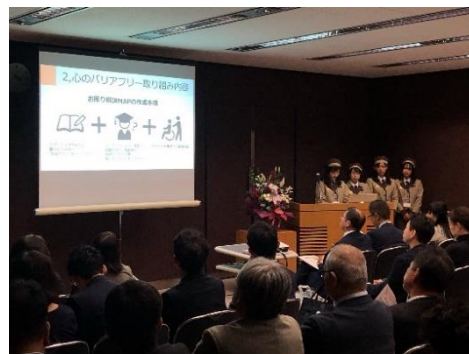
右：好事例企業の報告