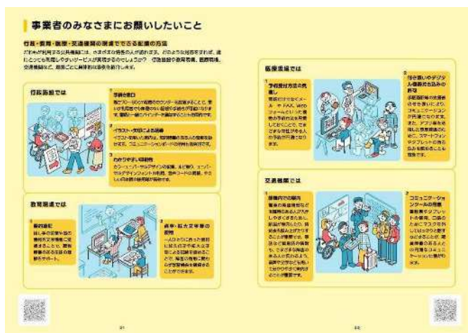
「さまざまな場面での配慮事例」を記載しているページ