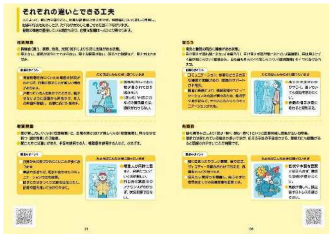
「さまざまな障害特性について」を記載しているページ