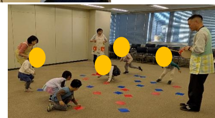
↑子どもお楽しみ会の様子