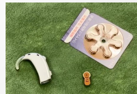
補聴器の電池交換の説明