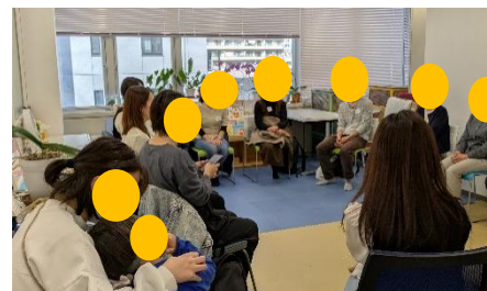
←保護者交流会の様子