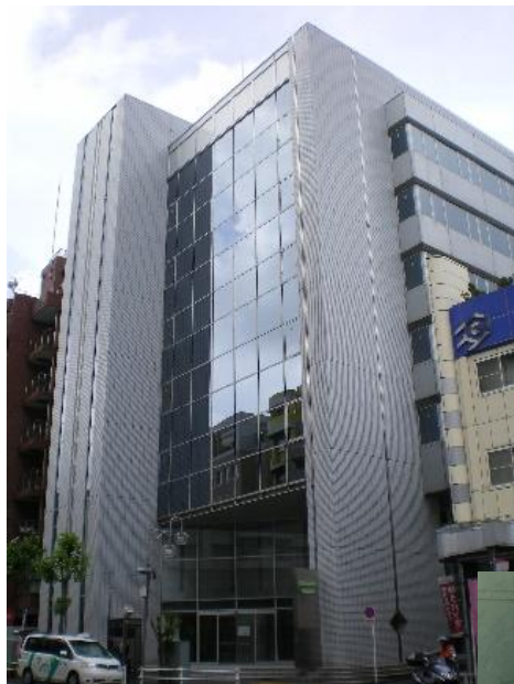
↑福祉財団ビル外観 看板→